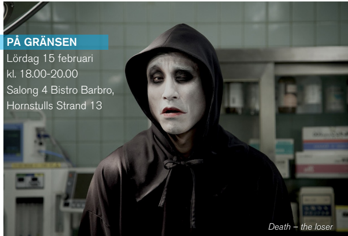
Death – the loser

Lördag 15 februari kl. 18.00-20.00 Salong 4 Bistro Barbro, Hornstulls Strand 13