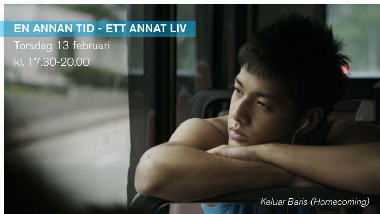
Keluar Baris (Homecoming)